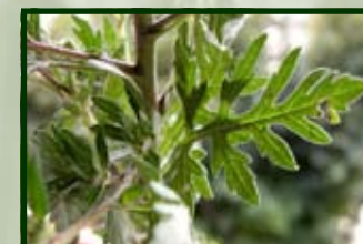
FUSTO E FOGLIE