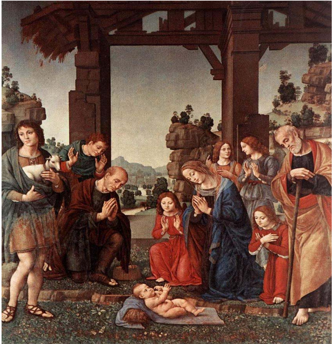
Domenico Ghirlandaio Natività 1485

Il Consiglio Direttivo di AIA augura a tutti voi un Buon Natale e Felice anno nuovo